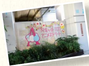
2014年3月に誕生した阿佐ヶ谷アニメストリート。JR中央線の高架下に、アニメのコスプレ体験やコスプレ撮影ができるショップやアニメ上映カフェなどが集結している。

阿佐ヶ谷駅と高円寺駅の間の高架下にあるアニメファンの交流スポット「阿佐ヶ谷アニメストリート」など、新しい魅力も生まれている阿佐ヶ谷駅。駅から放射状に延びるいくつもの商店街には新旧入り混じった多種多様な店が存在し、どこを歩いても新しい発見があり楽しい。