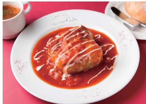
ロールキャベツ 1350円。赤ワインで煮込んだ後1日以上置くことで中の肉までしっかりと味が染みこみ、旨みが凝縮されている。トマトソースも1～2日かけて仕込む。

吉祥寺駅 創業から55年以上変わらぬ味わい シャポールージュ 料理長を中心に守り続けているのは、日本人が慣れ親しんだオーソドックスな洋食。熱烈なファンも多いというロールキャベツをはじめ、多い時には一日50皿出るほど人気のオムライスやハンバーグといった定番の洋食、さらには自家製オレンジソースの酸味がほどよいババロアなどデザートにも注目だ。 DATA ランチ11時～16時(L015時20分)・ディナー17時30分～21時(L020時20分)、木曜休。JR中央線吉祥寺駅北口から徒歩約5分。武蔵野市吉祥寺本町2-13-1 ☎0422-22-4139