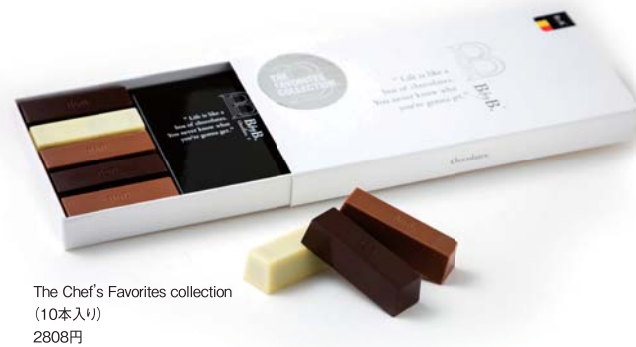
The Chef's Favorites collection (10本入り) 2808円