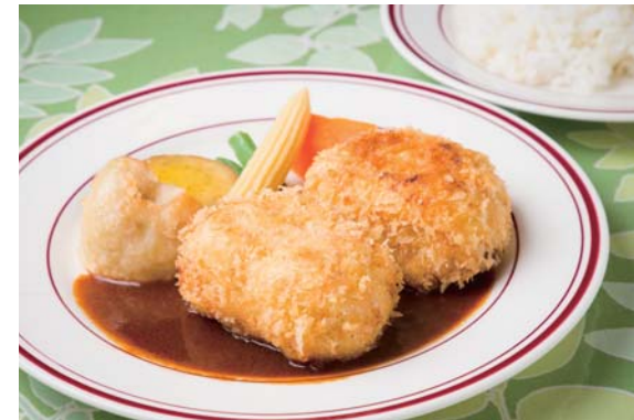
ポリウレタンでサクサクに仕上げた一番人気のカニクリームコロッケ定食1000円。タラバガニを使用したクリームはなめらかな口当たりで、自家製のデミグラスソースとマッチする。

八王子駅 地元で愛され続ける優しい味 グリル エスエム 八王子で43年間愛され続けてきた、兄弟で切り盛りしている老舗洋食店。料理長である兄は銀座「千足屋」の洋食部門などで修業した経歴を持つ。看板メニューのカニクリームコロッケのほか、豚肉の生姜焼きやオムライスなど、昔ながらの洋食を25～30種類揃え、出前も可能だ。 DATA 11時30分～L015時・16時30分～L020時30分、火曜休。JR中央線八王子駅北口から徒歩約10分。八王子市横山町21-13 ☎042-644-4628