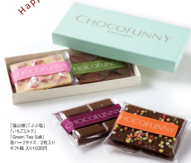
「塩山椒」「ぶぶ塩」「いちごミルク」「Green Tea Salt」各ハーフサイズ/2枚入りギフト箱入り1030円