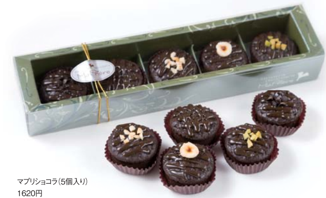
マプリショコラ(5個入り) 1620円