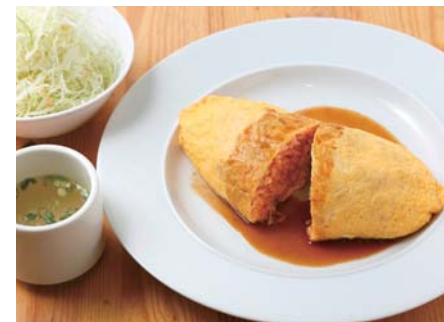
オムライス 900円。形もきれいに仕上げられ、フライパンを巧みに操る店主の技が光る。やわらかく、まろやかな味わいに昔からのファンも多い。

八王子駅 地元で愛され続ける優しい味 グリル エスエム 八王子で43年間愛され続けてきた、兄弟で切り盛りしている老舗洋食店。料理長である兄は銀座「千足屋」の洋食部門などで修業した経歴を持つ。看板メニューのカニクリームコロッケのほか、豚肉の生姜焼きやオムライスなど、昔ながらの洋食を25～30種類揃え、出前も可能だ。 DATA 11時30分～L015時・16時30分～L020時30分、火曜休。JR中央線八王子駅北口から徒歩約10分。八王子市横山町21-13 ☎042-644-4628