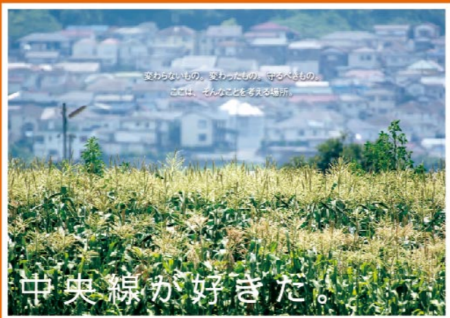
【撮影場所】 豊田駅~八王子駅間の浅川橋梁東側 真夏の日中、線路南側、住宅街の中のぼっかりとした空間にトウモロコシ畑。遠景には多摩丘陵の斜面に連なる家々。それを望遠レンズでくっきりと圧縮し、東京の農業を象徴する「農住近接」を表現しました。 投稿者/塚本 浩行様