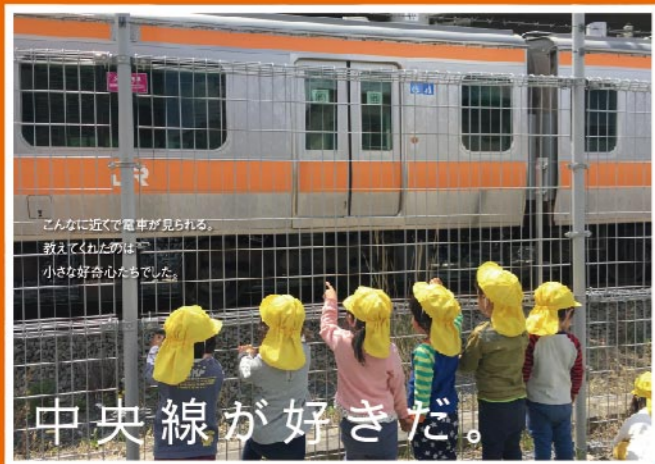
【撮影場所】 武蔵小金井駅付近 お散歩への誘い文句。「電車見に行く?」。不機嫌な子の気をそらす言葉。「あっ! 電車来たよ!」。子どもたちの好きな電車が近くで見れる穴場スポットです。