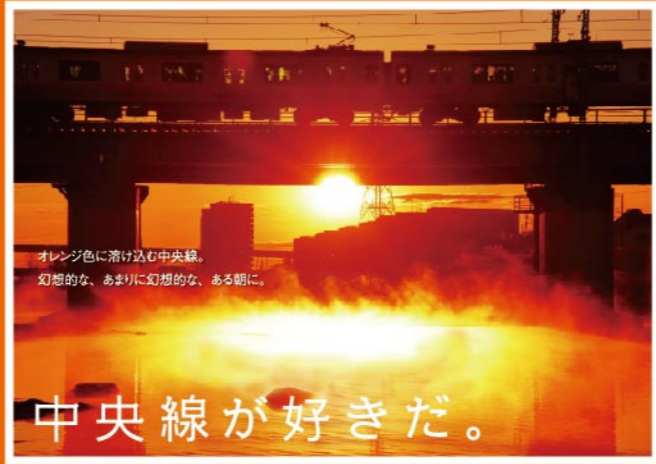
【撮影場所】 立川駅~日野駅間の多摩川鉄橋 1月下旬の氷点下の多摩川にて撮影しました。川霧が湧き上がる中、朝日が川霧を炎のように照らしてくれました。ほんの瞬間の光景でした。