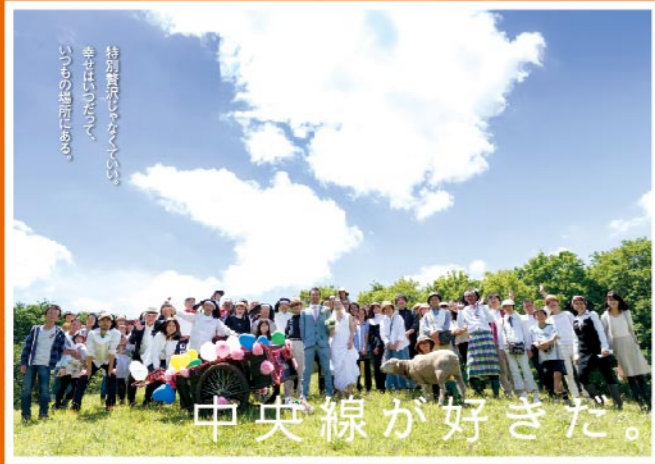
【撮影場所】 都立武蔵野公園のはらっぱにあるくじら山の山頂 大好きな武蔵野公園にてご近所のみなさんが作りあげてくださった、手作りの「はらっぱWedding」。奇跡のような快晴に恵まれ、近所の方々のあたたかい笑顔にかこまれて、心に残る素晴らしい一日になりました。

「あなたの(だから中央線が好きだ)をおしえてください」(応募期間は2017年7月21日~8月20日)キャンペーンに寄せられた530点の写真の中から、珠玉の4作品を選出。