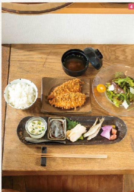
1-2. 階段下にある看板が目印。細やかな心配りがあちこちに。3. 駅近のビルながら窓が広くゆったり過ごせる。4. 本日のC定食小田原 地アジのフライ1400円。メニューは日替わり。