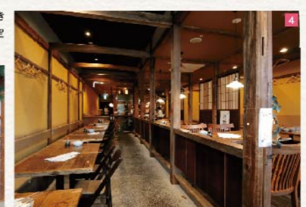
3. アルバイトの子が卒業制作で作った「招きかっぱ」が目印。4. 飛騨の古材を用いた粋な空間。奥にはカウンター席もあり。