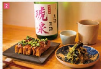
1. 店主の大月夫妻が選んだ雑貨も並ぶ、不思議な空間。2. アボカドとかいわれとのりのわさび和え450円、特製ねぎみそせ焼き厚揚げ600円をつまみに、季節の日本酒「琥泉」750円を。3. いろいろ野菜の揚げ春巻き コチュジャンだれ定食1436円。4. 古いマンションの1階にポッと温かい灯がともる。