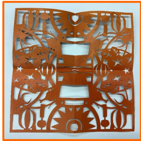
B.カッターで作る上級者向け