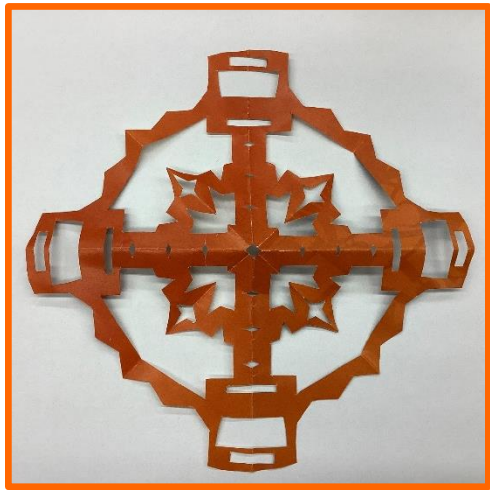
A.ハサミだけで作れる初心者向け