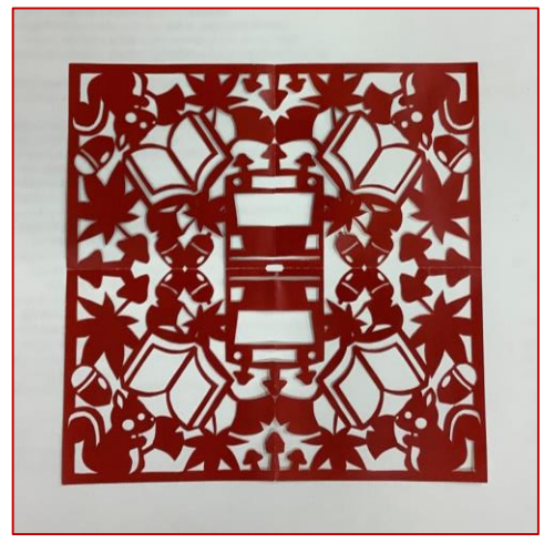
B.カッターで作る上級者向け