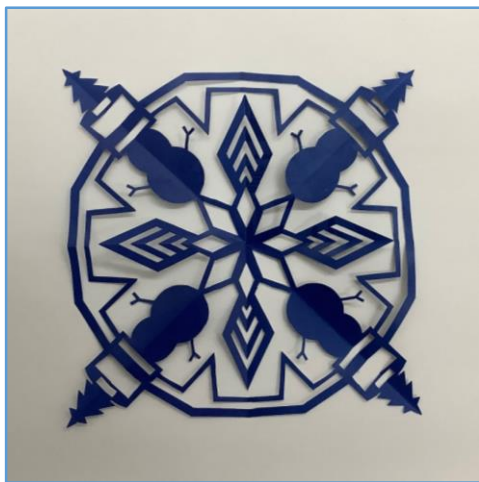
A.ハサミでだけで作れる初心者向け