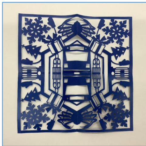
B.カッターで作る上級者向け