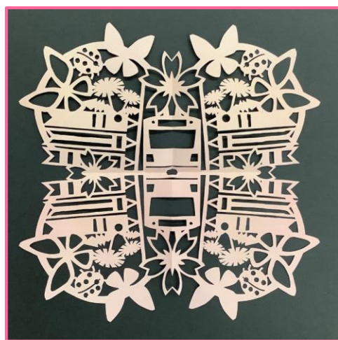
B.カッターで作る上級者向け