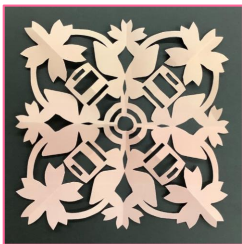
A.ハサミでだけで作れる初心者向け